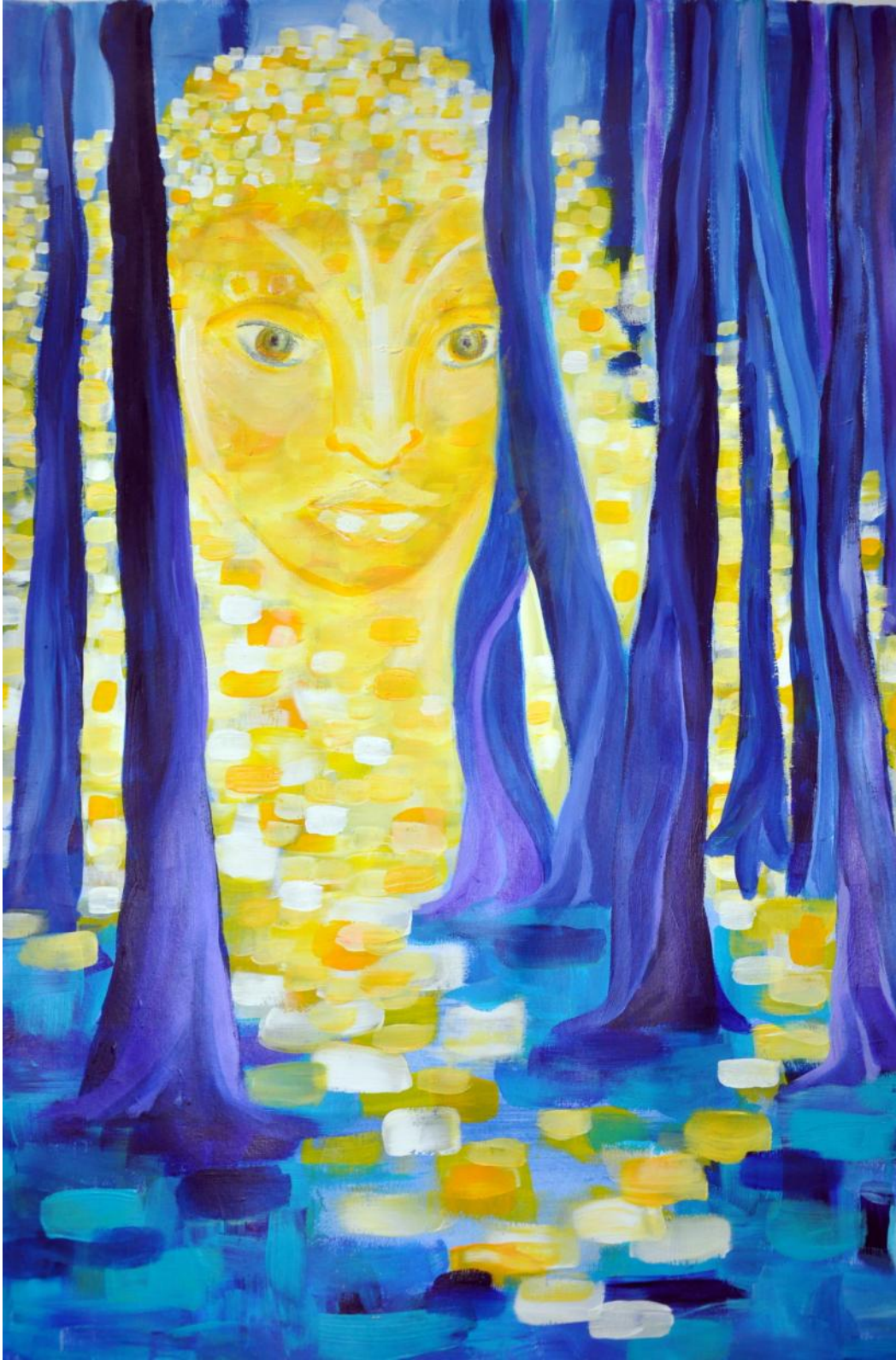
malerei: erika, acryl