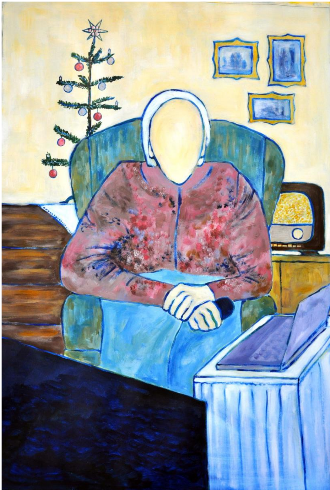
weihnachten 2020, acryl erika gewidmet allen menschen in den pflegeheimen und all den menschen, die in diesen tagen alleine waren/sind