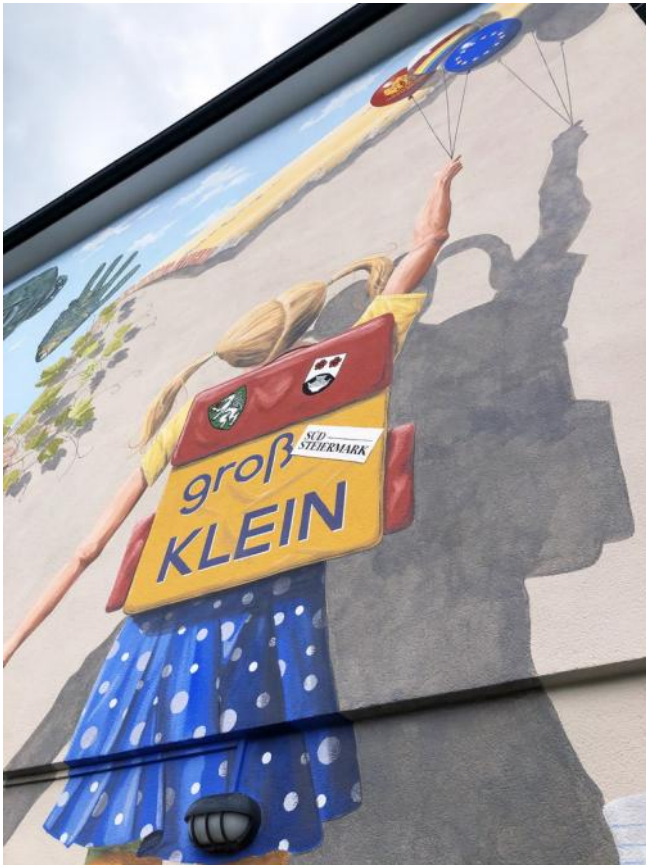
teil der hausfassade der volksschule in großklein

wir freuen uns auf die ersten pride tage in groß- klein. das motto: