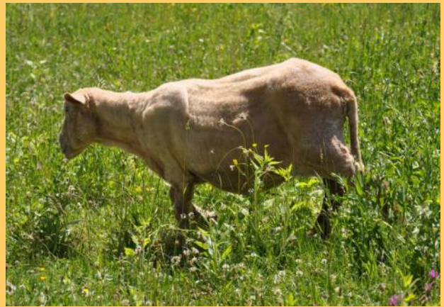
ricki (die schafe sind bereits geschoren, die lamas kommen demnächst dran...)