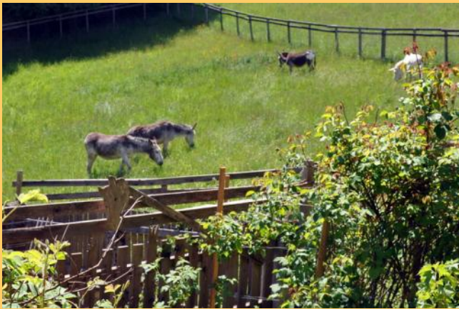
die esel auf der weide