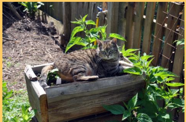
luna maroni in den physalis....