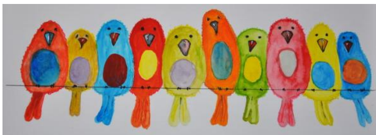
einige malereien von: alexandra, anita und hildegard